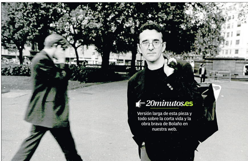
Eternamente transterrado. Roberto Bolaño: infancia chilena, juventud mexicana y madurez española.

Murió, justo entre Compañy Segundo y Celia Cruz en el timing bolanista de las defunciones, soñando con Kafka, viendo arder el mundo mientras los Titanes luchaban en el cielo de Nueva York.